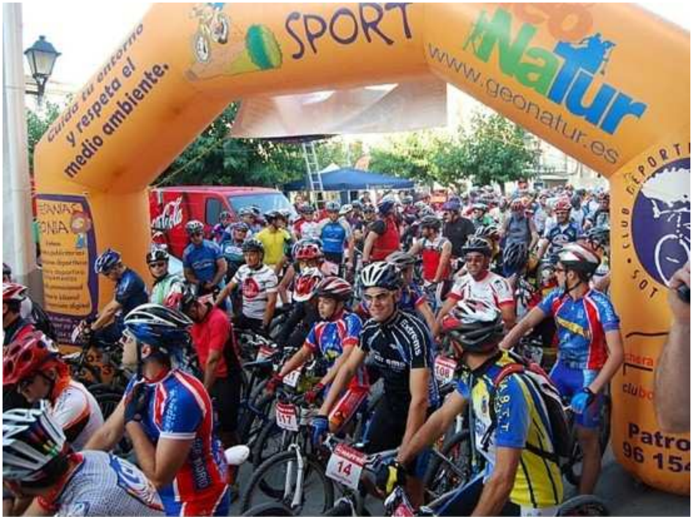
Minutos antes de la Salida de la Marcha