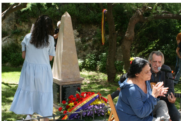
Vicente Medina. Fotografía y Textos