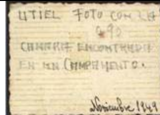
Foto realizada con la cámara encontrada en el campamento guerrillero de Cerro Moreno. Guardias de paisano en Utiel, noviembre, 1949.

Lo ocurrido en Cerro Moreno fue un duro golpe que no acabó de asimilarse, ciertamente fue un punto de inflexión en el devenir del AGLA. Hasta José Gros lo recordará casi un año después cuando en 1950 se persone en sus campamentos, también con “Ibáñez” y “José el Alicantino”, para realizar algo más que un informe del estado de la lucha armada y tantear la orden del abandono del monte. El número de guerrilleros muertos, la forma de ser enterrados, la desigual y contundente fuerza de la GC, la duración de todo el operativo, la huida de uno de los guerrilleros, el desconocimiento de varios de los nombres, la ignorancia de dónde estuvo la traición, la propia información omitida y prohibida durante tanto tiempo, todo ello dio origen a múltiples formas de recreación de lo sucedido que de alguna manera configuran el mito y la leyenda, el ensueño y la realidad de Cerro Moreno. No sé hasta qué punto la oralidad, en este caso, no puede ser aceptada también como método de conocimiento.