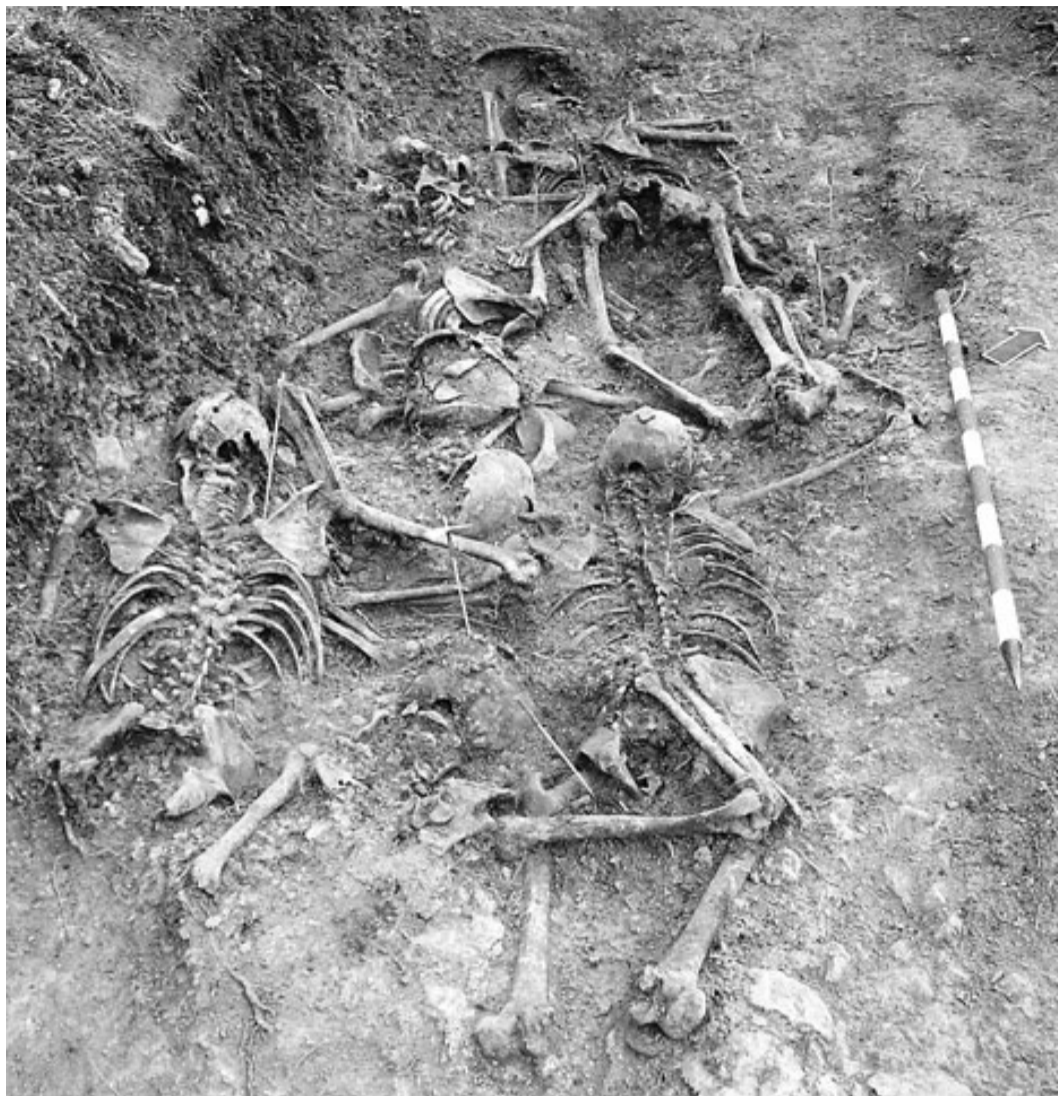
Aspecte d'una excavació de Paleolab a Alcalá de la Selva (Terol).

mitjana de dues exhumacions per any. Hem intervingut a Almansa, La Ginebrosa, Fuertescusa, Alcalá de la Selva, Villarejo de la Peñela, Monroyo i Singra.»