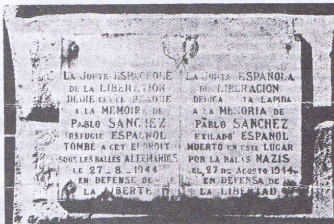
Au 54, Quai Richelieu

Dès 1941, des réfugiés espagnols en France commencent la lutte contre le nazisme. Leur action sur les troupes d'occupation allemande sera marqué par une remarquable efficacité. Au début de l'année 1943 furent créés plusieurs groupes de résistants pour combattre l'ennemi commun. Dès que ces combattants de l'ombre étaient arrêtés et déportés, d'autres groupes se reformaient et les sabotages et exactions continuaient, harcelant le commandement allemand. C'est ainsi qu'en 1943, les guérilleros firent sauter un grand garage que les troupes motorisées allemandes détenaient à La Bastide. En décembre de la même année, c'était un câble souterrain qui reliait l'aéroport de Mérignac aux unités allemandes cantonnées le long de la côte atlantique qui était saboté. En février 1944, ils déclenchaient un gigantesque incendie de baraques en bois, à la Benauges, où les allemands abritaient de nombreux services administratifs.