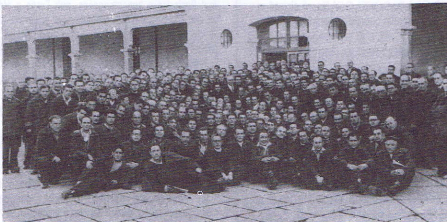
Prisioneros anti-franquistas en el Penal de Burgos a los veinte años entre losas y rejas.