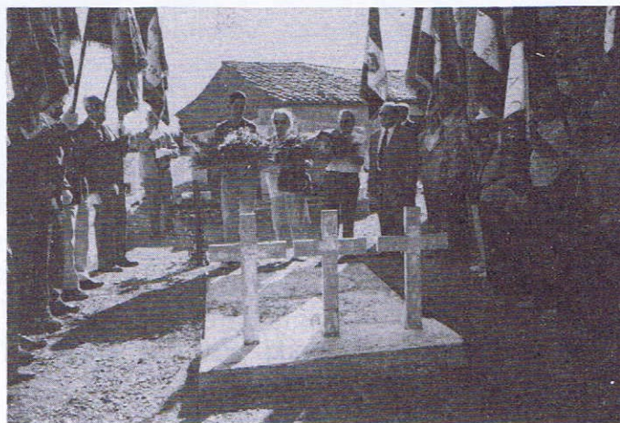
Le 1 Août 1993 - Hommage rendu sur les tombés des trois Guérilleros tombés à la Bastide (P.O.) le 2 Août 1944 - par l'A.A.G.E.- F.F.I. et l'ANACR

Après le succès des cérémonies, les participants se retrouvèrent à une super-grillade organisée à la Bastide.