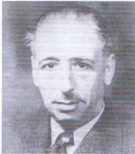
Lluís COMPANYS I JOVER