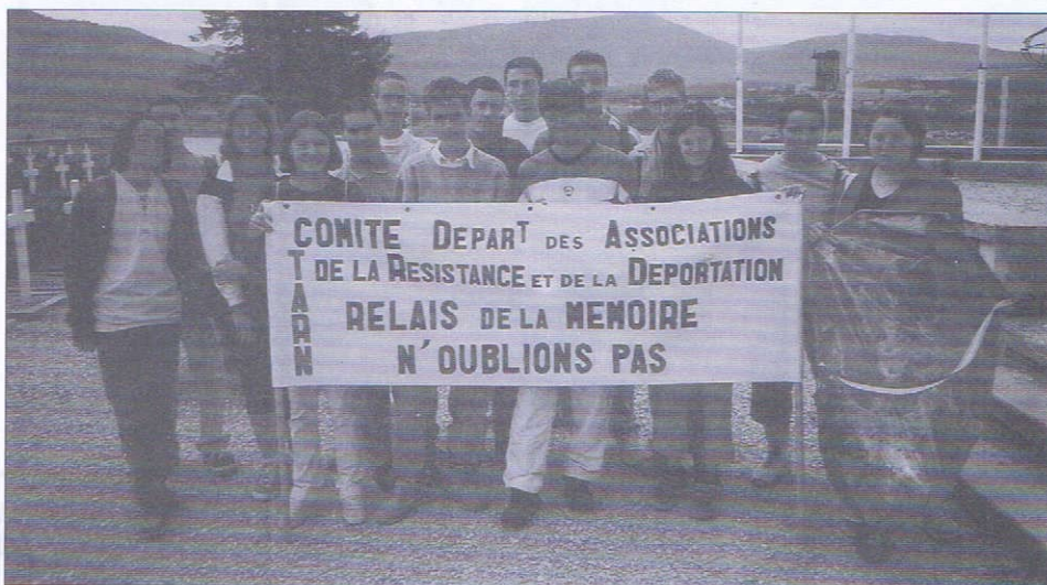
Les quinze lauréats tarnais du Concours de la résistance et de la déportation, pour le voyage pèlerinage annuel (9 au 13 juillet) au Vercors mémoire et histoire

Car ce voyage fut pour tous l'occasion de ses souvenir, les uns de ce qu'ils avaient vécu, les autres de ce qu'ils avaient appris. Et c'est cette confrontation qui est intéressante. L'histoire forte de la Résistance et la géographie physique puissante de cette région caractérisent ces lieux symboliques. Le village de Vassieux-en-Vercors est l'épicentre du drame, quand la forteresse résistante devint souricière. Le monument aux victimes civiles et les carcasses des planeurs nazis allemands figées près du musée, la nécropole où les élèves déposent une gerbe de fleurs, le cimetière, tout rappelle de funestes épisodes. Ils sont émus et attentifs. L'un d'entre eux Arnaud