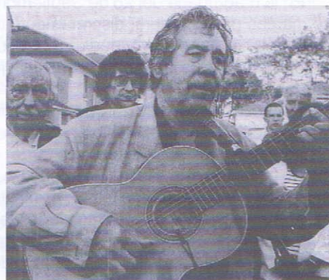
Paco Ibañez a interprété « Andaluces » de Jaen en hommage à Miguel Hernandez.