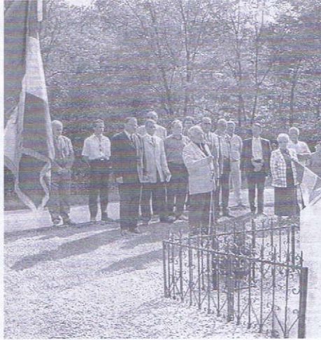
Une cérémonie poignante qui s'est tenue dernièrement à l'Affenadou.

Mais après la débâcle de 1940, et face à la haine déclarée par le régime de Vichy à