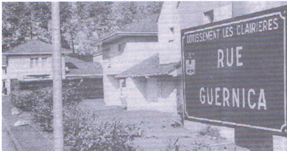
La rue Guernica fut inaugurée lundi.

Lundi 29 et mardi 30 octobre, des cérémonies ont rendu hommage aux maquisards espagnols qui ont combattu le franquisme dans leur pays après avoir lutté aux côtés de la Résistance, en France.