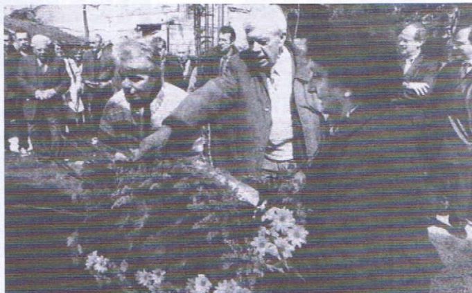
Les Espagnols fidèles à la République.

Un repas fraternel a été peu après servi dans la Cafeteria, repas qui a réuni une centaine de membres des associations amies et qui, de l'avis général a été un succès complet.