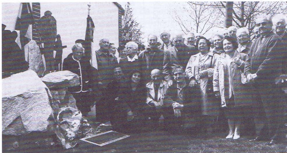
Fotografía de un grupo de los asistentes, junto al Monumento, luego de haber sido depositadas las flores.

Como se había anunciado en el anterior « Boletín », y al igual que lo hacemos desde bastantes años ; las asociaciones departamentales del Alto Garona : (« Ex Combatientes Republicanos », « Alas Plegadas » y « L'Amicale des Anciens Guerrilleros Espagnols en France (FFI) » se reunieron el pasado lunes 14 de abril para conmemorar el « 72 aniversario de la proclamación de la II República Española ».