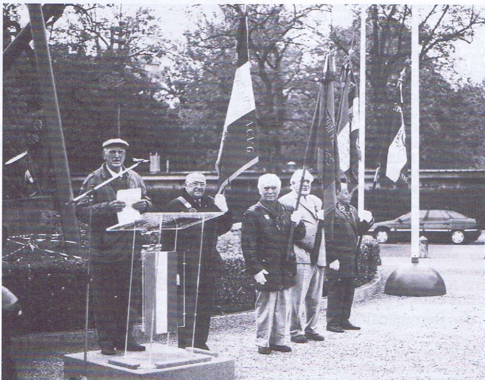
Toulouse le 26 mai 2003. Souvenir du 58 e anniversaire de la libération de l'Italie.

En dépit de l'époque critique que nous vivons, regardons résolument vers le futur, dans l'espoir d'une victoire que l'his-