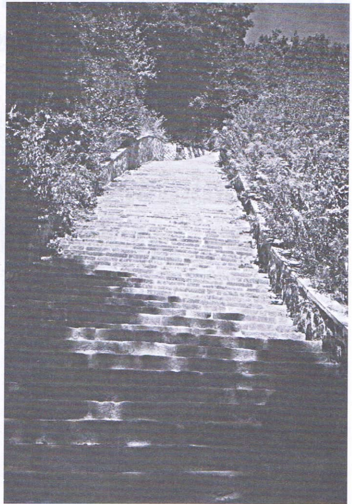
Escalier de la mort, carrière Mauthausen.

Les camps représentent le pire mais aussi le meilleur de ce que l'Homme est capable de faire. En effet, nos aînés nous font part des actes de solidarité entre déportés, preuves de la force de l'Humanité, même dans les circonstances les plus dures. Nous avons maintenant grâce à eux des informations supplémentaires sur la déportation, mais nous ne pouvons toujours pas comprendre, encore moins accepter.