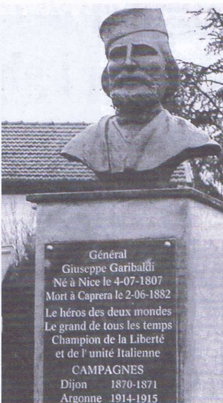
Garibaldi a enfin sa stèle.

Combien ont été emprisonnés et torturés par les bandes des chemises noires durant la triste époque Mussolinienne pour n'avoir pas accepté la déchéance de l'Être Humain