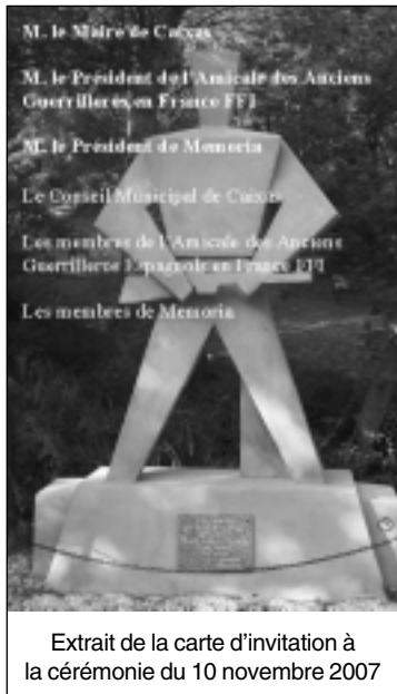
Extrait de la carte d'invitation à la cérémonie du 10 novembre 2007